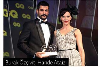
Burak Özçivit, Hande Ataizi