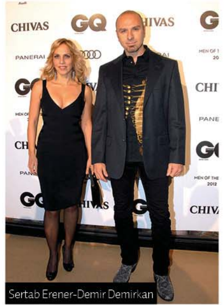
Sertab Erener-Demir Demirkan