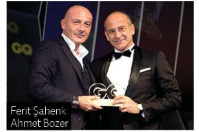
Ferit Şahenk Ahmet Bozer