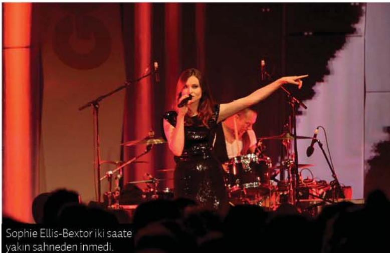
Sophie Ellis-Bextor iki saate yakın sahneden inmedi.

Kokteylle başlayan GQ Men of the Year 2012, renkli görüntülerin yaşadığı ödül töreni ile devam etti. Demirden Design tarafından geceye özel tasarlanan iki taraflı sahne önce ödül alan ünlüleri ağırladı. Davetiler ödül töreninin ardından diğer tarafta yer alan ikinci bir sahnede Sophie Ellis-Bextor'ın şarkıları eşliğinde geceye devam ettiler.