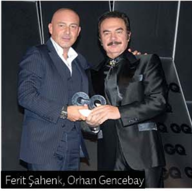
Ferit Şahenk, Orhan Gencebay