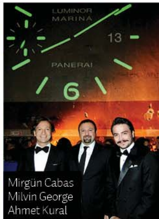
Mirgün Cabas Milvin George Ahmet Kural

giz Temel'le birlikteydi, sürekli dans etti ve herkesin en çok arzu ettiği insan olan Burak Özçivit'e ödülünü o verdi. Hande Ataizi'nden pek hoşlanmıyorum sanırım. Güzel, başarılı ve Benjamin'le evli. Mutlu insanları sevmiyorum. Benjamin Harvey'i gülümserken ve eğlenirken görmekse epey şaşırtıcıydı. Kendisi asık suratıyla meşhurdur. Hande'nin elbisesi kocasının hediyesiymiş ve Philip Treacy şapkasını ise Atelier 55'ten almış. Moralini bozmak için "Ay gerçek değildir o şapka. Borularını büküp büküp kendileri yapmışlardır" dedim ama yemedi sanırım. Bazı kadınlar çok kıskançlar, Ataizi ödül vermeden önce kenarda beklerken bir kadın sürekli konuşmamızı bölüp bizimle iletişim kurmaya çalıştı. Ünlülerle diyalog halindeyken rahatsız edilmekten hiç hoşlanmıyorum. Hemen ona gerekli cevabı verdim ama biraz sert oldu sanırım çünkü artık gecenin sponsorunun etkisi, damarlarımda dolaşırken açık açık hissedilmeye başlamıştı.