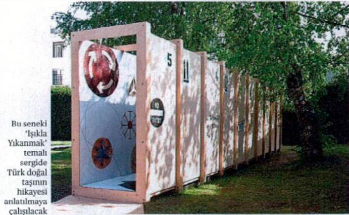
Bu seneki 'Işıklı Yıkanmak' temalı sergide Türk doğal taşın hikayesi anlatılmaya çalışılacak

Doğal taş çeşitliliğinde dünyanın sayılı ülkeleri arasında yer alan (mermer çeşitliliği açısından 132 ülke içinde 10. sırada) Türkiye, doğal taş ihracatında 2012 yılında elde ettiği 1,9 milyar dolarlık ihracat değeri ile Çin ve İtalya'nın ardından üçüncü sırada yer aldı. Aslında bu tamamına yakını mermer-traverten ürünlerinden oluşan bir ihracat sıralaması. Ülkedeki granit rezerv ve çeşitliliğinin sınırlı olması dolayısıyla toplam doğal taş