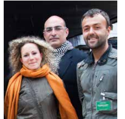
DEMİRDEN DESIGN 1994'ten beri mekan tasarımı, grafik tasarım, ürün ve ambalaj tasarımı gibi farklı alanlarda uzmanlaşmış tasarımcıların oluşturduğu ekip ve disiplinlerarası yaklaşımlarıyla her projeye özel, bütüncül çözümler sunuyor. Bugüne kadar aralarında birçok Red Dot, 2 iF Gold ve Design Management Europe ödülleri de bulunan 19 uluslararası ödüle layık görülen Demirden Design aynı zamanda uluslararası tasarım dünyasında büyük ses getiren "ilio" masaüstü ürünler markasının da yaratıcısı.