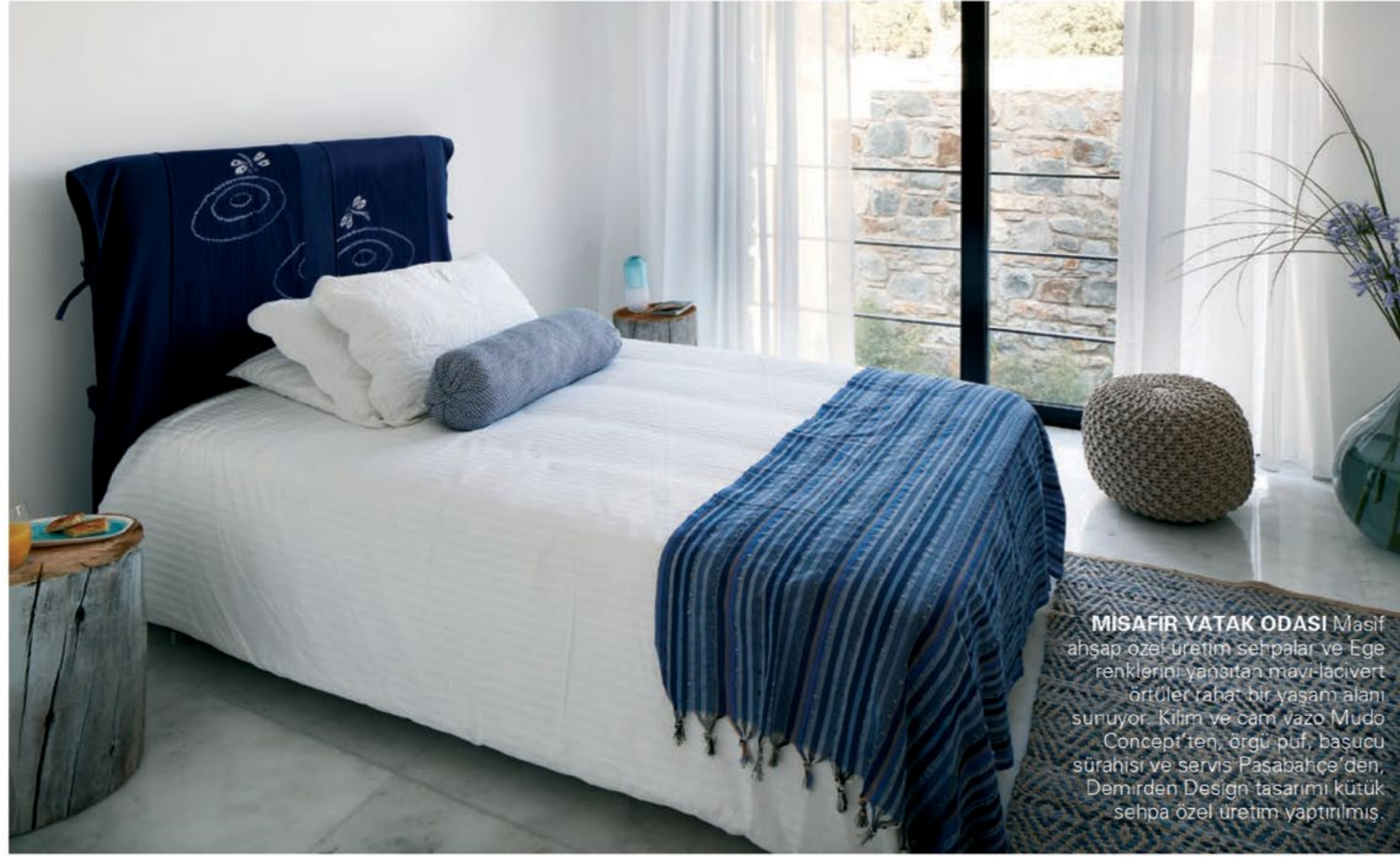
MISAFİR YATAK ODASI Masif ahşap özel üretim sehpa lar ve Ege renklerini yansıtan mavilacivert örtüler rahat bir yaşam alanı sunuyor. Kilim ve cam vazo Mudo Concept'ten, örgü puf, başucu sürahi ve servis Paşabahçe'den, Demirden Design tasarımı kütük sehpa özel üretim yaptırılmış.