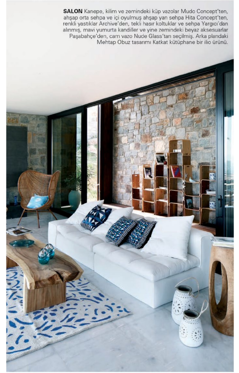
SALON Kanepa, kilim ve zemindeki küp vazolar Mudo Concept'ten, ahşap orta sehpa ve içi oyulmuş ahşap yan sehpa Hita Concept'ten, renkli yastıklar Archive'den, tekli hasır koltuklar ve sehpa Yargıcı'dan alınmış, mavi yumurta kandiller ve yine zemindeki beyaz aksesuarlar Paşabahçe'den, cam vazo Nude Glass'tan seçilmiş. Arka plandaki Mehtap Obuz tasarımı Katkat kütüphane bir ilio ürünü.