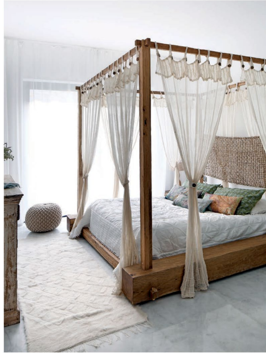
EBEVEYN YATAK ODASI Doğanın yeşil ve yaprak tonlarını taşıyan yastık ve minderleri, masif ahşap mobilyaları, ham pamuklu örtüleri ve yünlü kilimi ile sakin bir mekan. Yatak, yatak örtüsü ve yeşil yastıklar Mudo Concept'ten, renkli yastıklar Archive'den, kilim Bodrum Havlu'dan, örgü Puf Paşabahçe'den, ahşap dolap Hita Concept'ten, cam vazo Nude Glass'tan seçilmiş. Tablo Emel Albayrak'a ait. SPA-BANYO Sade bir küveti merkezine ve doğal gün ışığını içeriye alan spa-hamam, sihirli bir atmosfer adeta. Oval küvet ve Artema armatür Vitra'dan, ahşap tabure Mudo Concept'ten, mavi Buda Paşabahçe'den, cam mumluklar Nude Glass'tan alınmış; mekanda kullanılan ahşap dişbudak ağacı Thermowood.